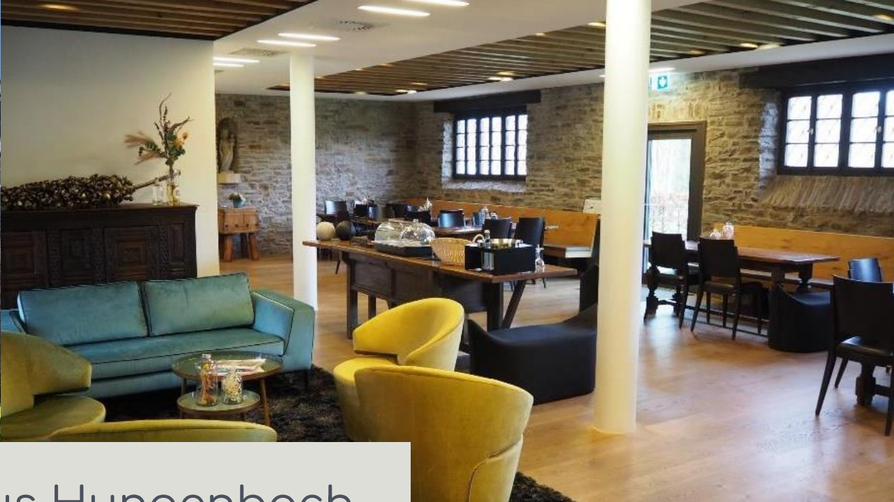
Restaurant Haus Hungenbach