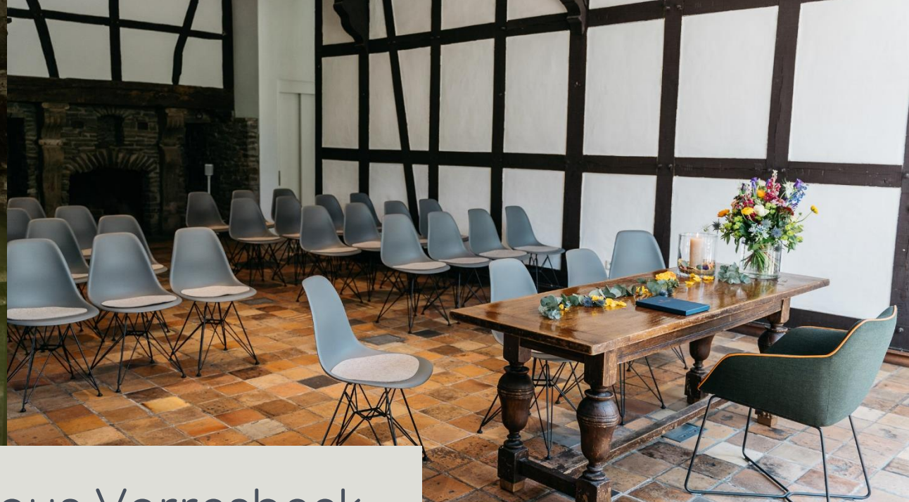
Rittersaal im Haus Varresbeck